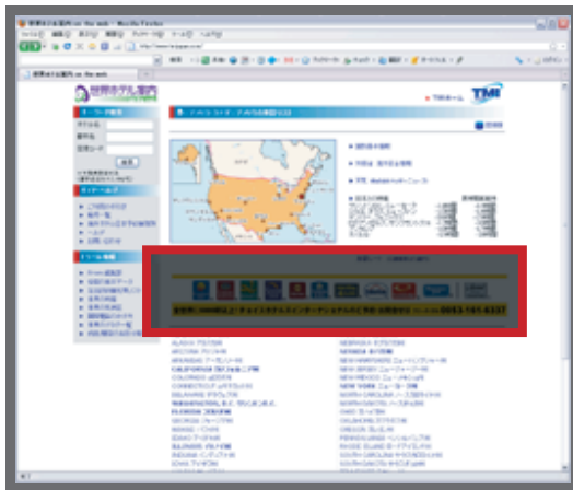
サンプル:アメリカの州の一覧