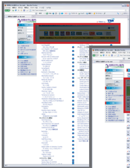
サンプル:国や州別の都市の一覧