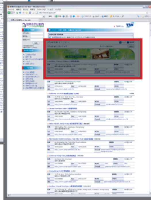
サンプル:各都市のホテルの一覧