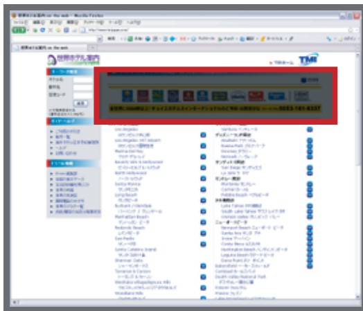
サンプル:国や州別の都市の一覧